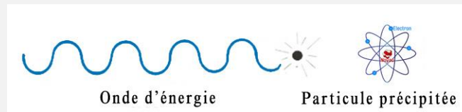
Dessin du livre «Comment créer la réalité» Ramtha

L'Énergie est cachée dans l'onde qui la transporte et l'onde est créée par notre pensée. Lorsque nous nous concentrons sur une pensée, nous affectons l'onde qui a comme pour effet de précipiter l'Énergie hors de l'onde. Plus nous nous concentrons sur notre pensée, plus il y a de l'Énergie précipitée. Cette Énergie se coagule et devient matière, l'objet de notre désir.